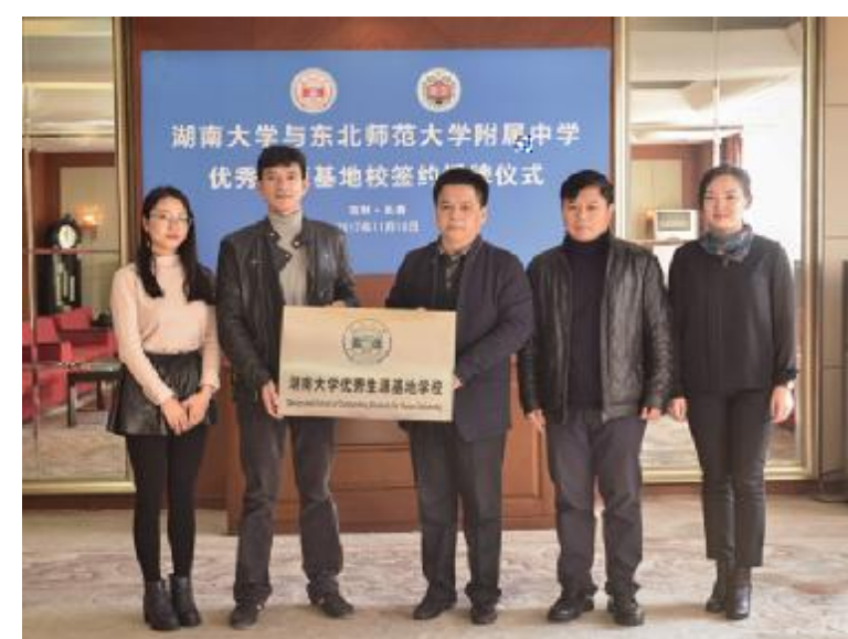
A. 9 质wx 断bc 9' J K 模式 x 断l t 表r + g. E 还b 到>

98. ' X * @ A T 文 > 策略BU 核z 素K % t @ K + 代 @ A. ' Ct 五ZV 历史. / u 革 W _ 必X 回Y > g h; # 使% . ' Z [ \ ] ' f A 35 届. 9 百花 ^ _ 满 @ # a A, s 98 核z 素KC ; ; 还 > o bc 98 素K # j H. 9u 革是 ^ 们C 贯6 立 b9' c 身5q # J / 98 核z 素K 是 ^ 们p CL 1