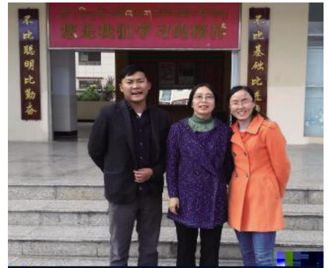
宾 老 师 1 3 Z 谈 ( 老 师 官