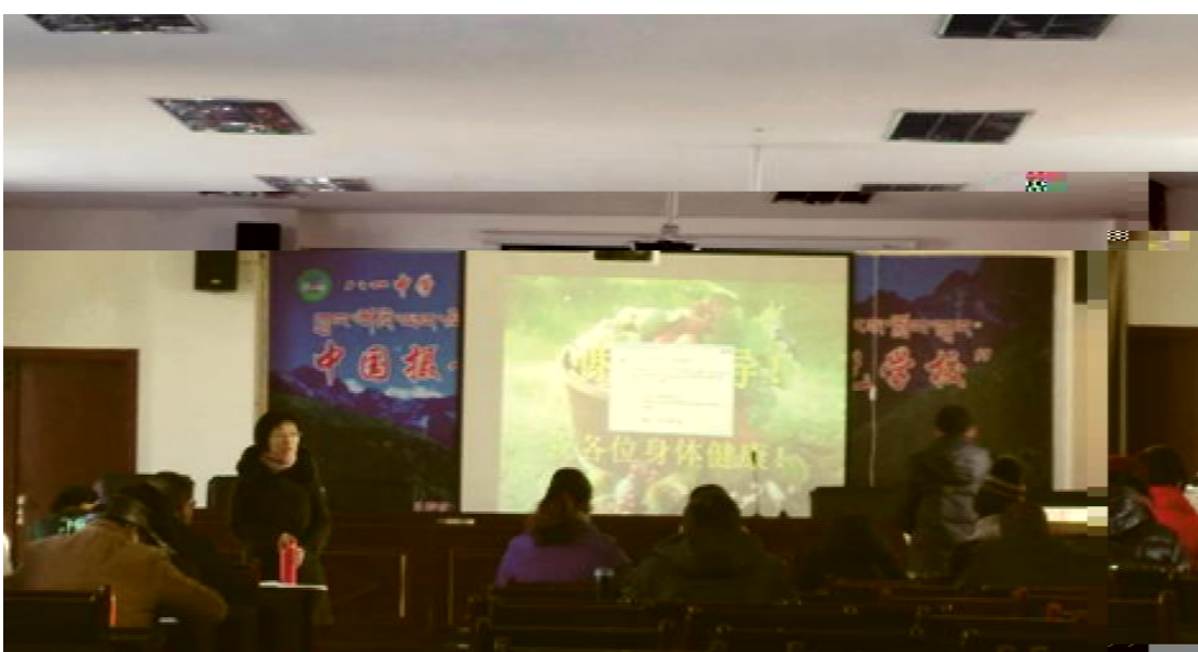
孙 AA 老 师 钟 推 大 组 宣 " H 课 " 教 研