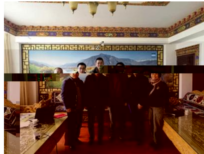
孙 AA 老 师 地 区 H 课 Y y