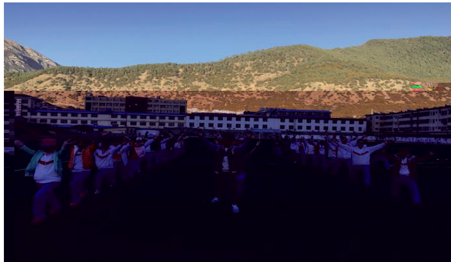
云 老 师 政 学 这 了 公 课 r T 教 学